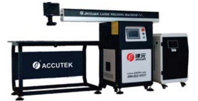
MASAÜSTÜ LAZER KAYNAK

uzmankutuharf@gmail.com www.uzmankutuharf.com