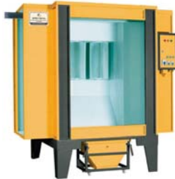
ELEKTROSTATİK TOZ FIRIN BOYA