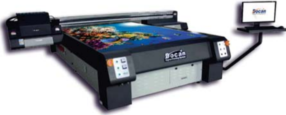
200x300 cm UV BASKI