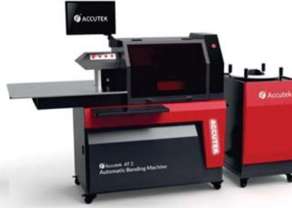
1.5 mm x 13 cm KROM ALÜMİNYUM KUTU HARF MAKİNASI