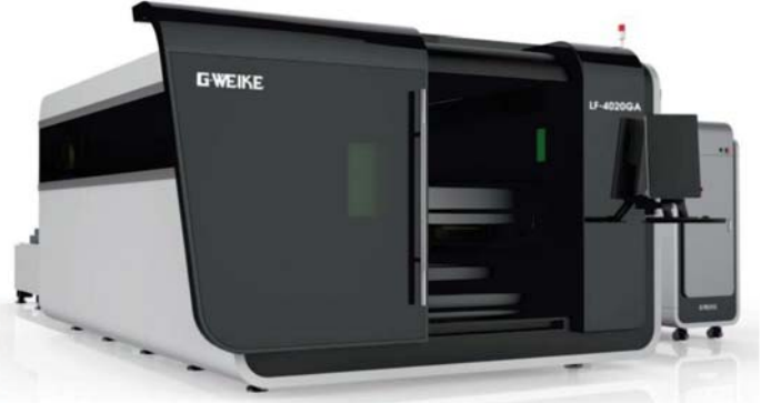
150x300 cm ÇİFT TABLA 2200 W FİBER LAZER 20x600 cm BORU - PROFİL KESİM FİBER LAZER