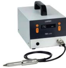
KROM NOKTASAL KAYNAK