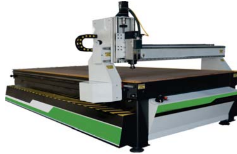
200x400 cm CNC KESİM