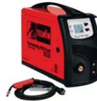
ALÜMİNYUM GAZALTI KAYNAK