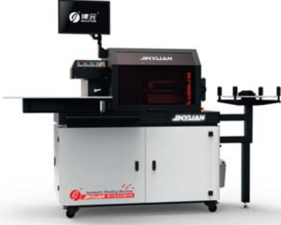
2 mm x 20 cm KROM ALÜMİNYUM KUTU HARF MAKİNASI