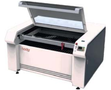
130x90 cm LAZER KESİM